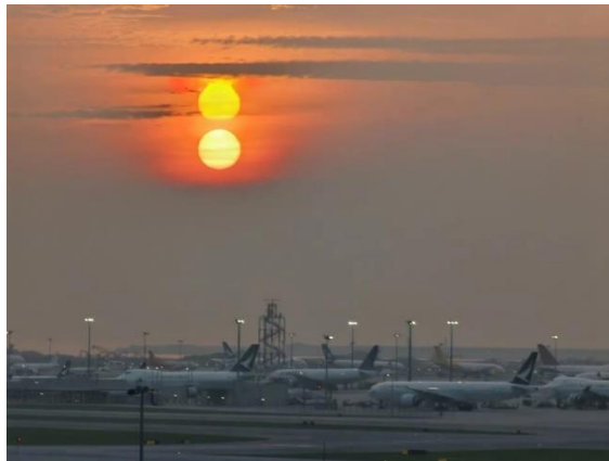
Фото. Гонконг 15-06-2023