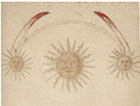
Рисунок . 10-02-1639