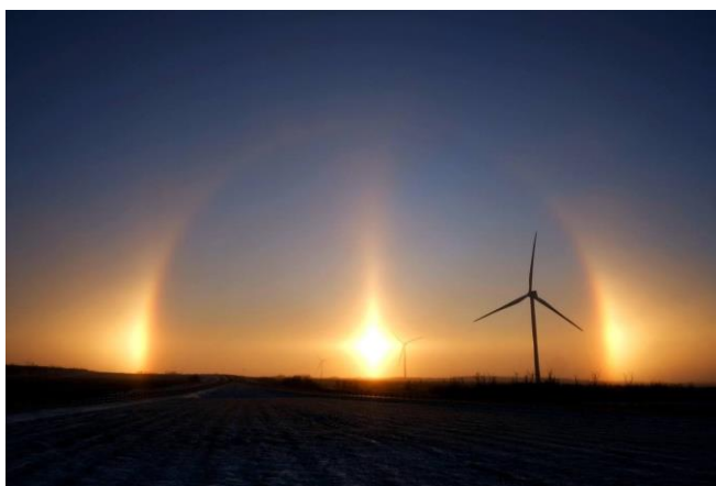
Фото. Ростовская обл. 7-01-2023